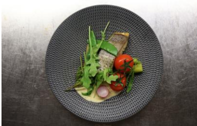
Un des plats gastronomiques du restaurant...

PRO EVOLUTION ECHECS → Plus d'infos sur le site: https://www.hoteldelapointefouesnantlesglenan.fr/