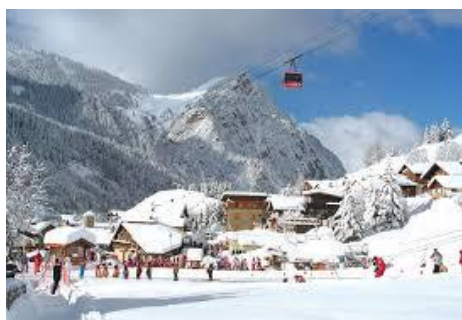
La jolie station de Pralognan !