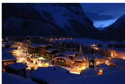
Venez découvrir une jolie station paisible de Savoie !