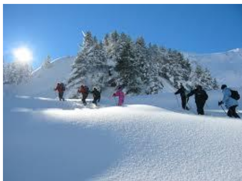
Un espace privilégié pour une balade et même une randonnée...