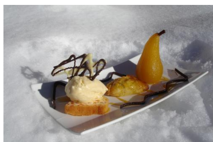
Place au dessert du chef !