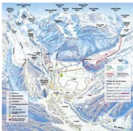
Le domaine skiable...