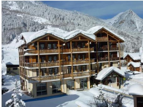
Hôtel du Grand Bec en hiver...

STAGE COMBINE A PRALOGNAN LA VANOISE - HIVER 2025