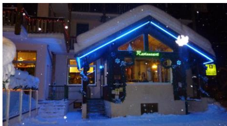
Le restaurant de l'hôtel