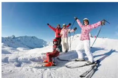
Le ski, c'est le top !

STAGE COMBINE A PRALOGNAN LA VANOISE - HIVER 2025