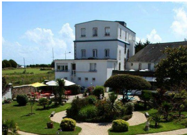
Hôtel de la pointe*** à 100 m de la mer !

⇒ Plus d'infos sur le site: https://www.hoteldelapointefouesnantesglenan.fr/